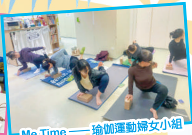
Me Time——瑜伽運動婦女小組