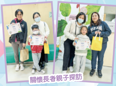
關懷長者親子探訪